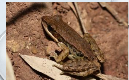
กบอ่องเล็ก ( Rana nigrovittata )