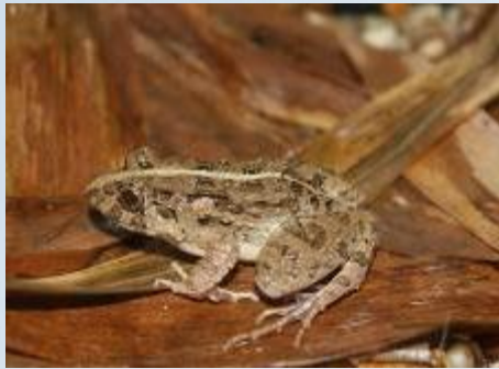
กบหนอง ( Fejervarya limnocharis )