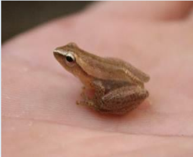
ปาดจิ้วพม่า + ( Chiromantis vittatus )