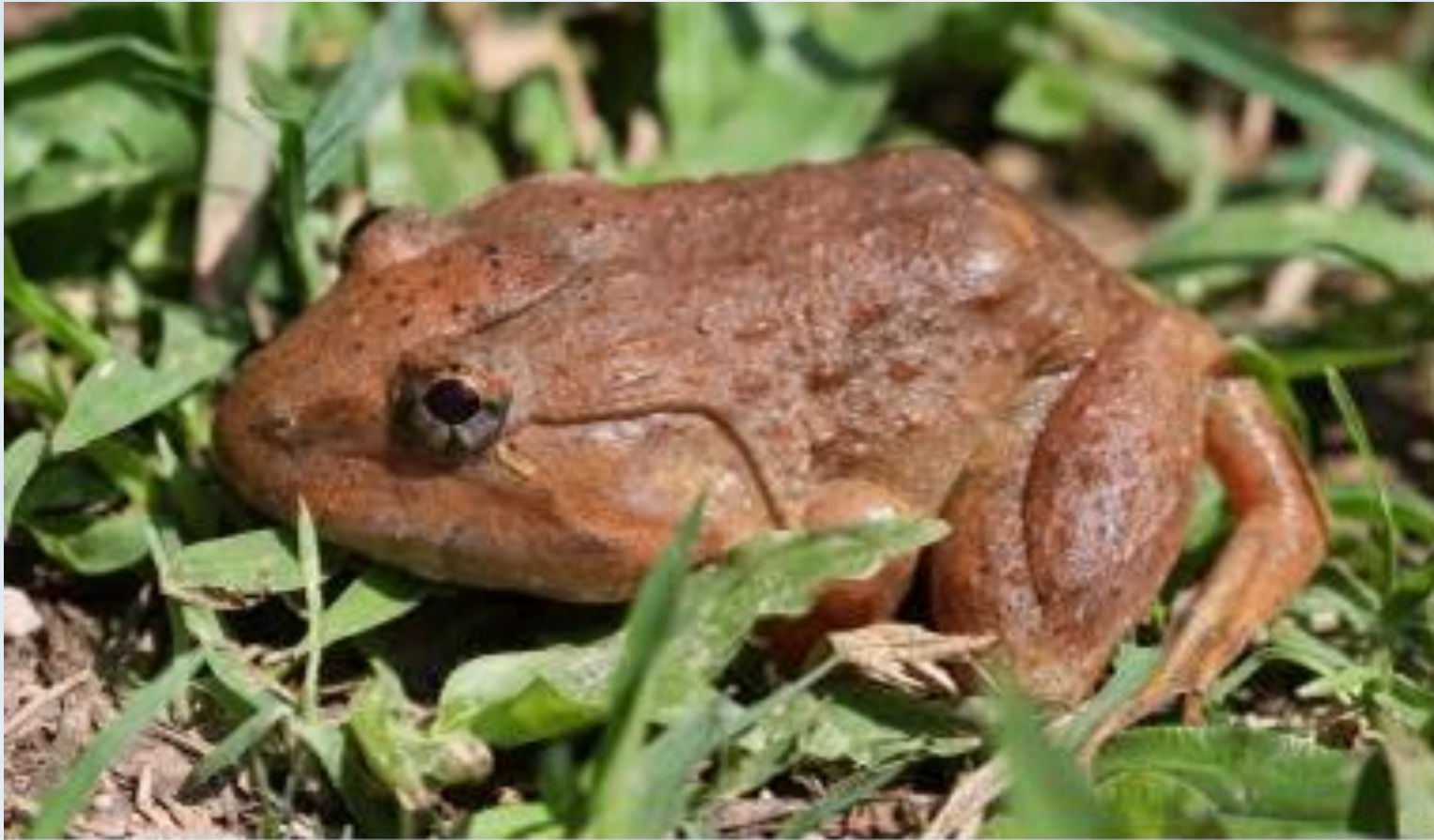
กบหนอง ( Limnonectes gyldenstolpei )