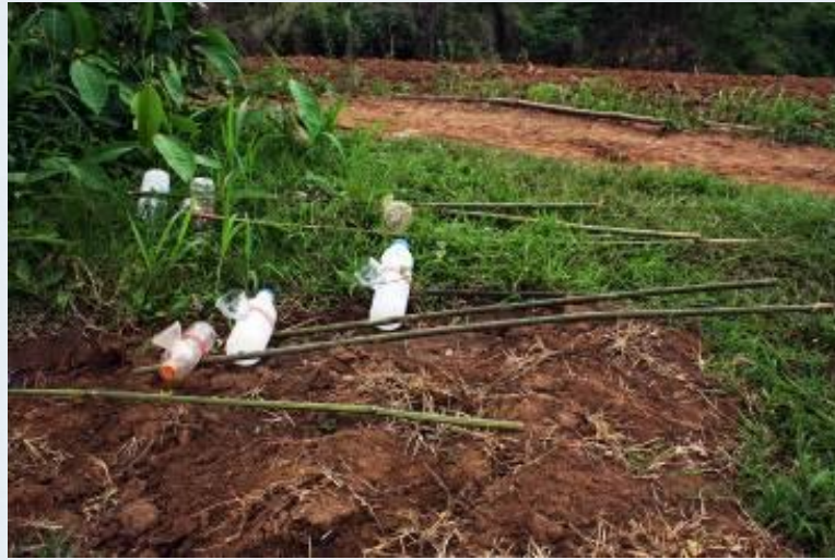
อุปกรณ์สำหรับจัดสัตว์สะเทินน้ำสะเทินบก