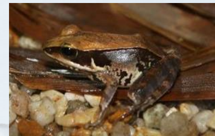
กบหลังไพล ( Rana lateralis )