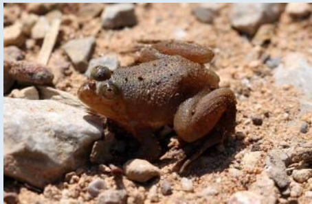
เขียดจระนา ( Occidozyga lima )