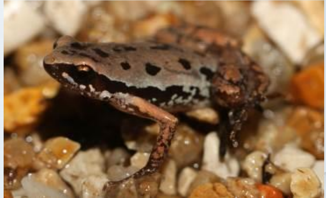
อิงหลังจุด ( Micryletta inornata )