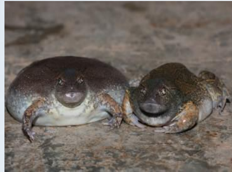
อิง पै้า ( Glyphoglossus molossus )