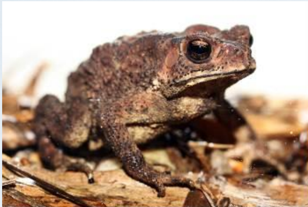
คางคกบ้าน ( Duttaphrynus melanostictus )