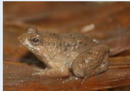
เขียดทราย ( Occidozyga martensii )