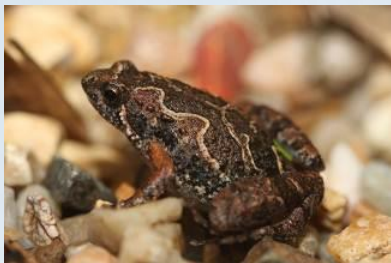
อิงลายเลอะ ( Microhyla butleri )