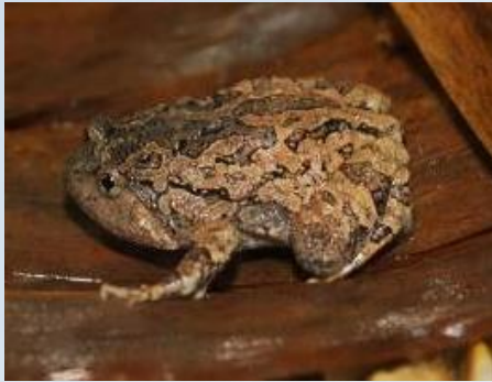
อิงลาย ( Calluella guttulata )