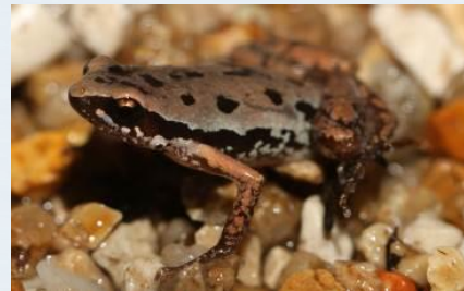
อิงหลังจุด ( Micryletta inornata )