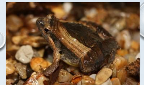
อิงขาคำ ( Microhyla pulchra )