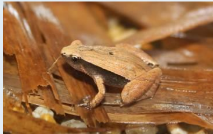
อิงข้างดำ ( Microhyla heymonsi )