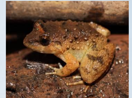
กบหัวโต ( Limnonectes macrognathus )