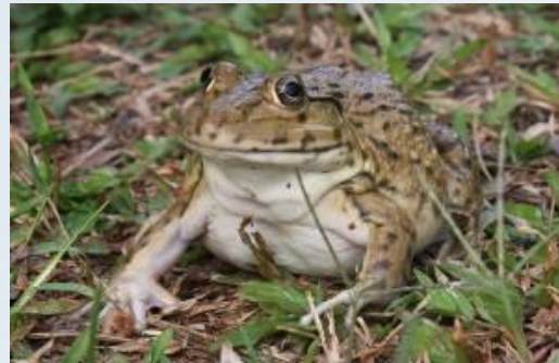
กบนา ( Hoplobatrachus rugulosus )