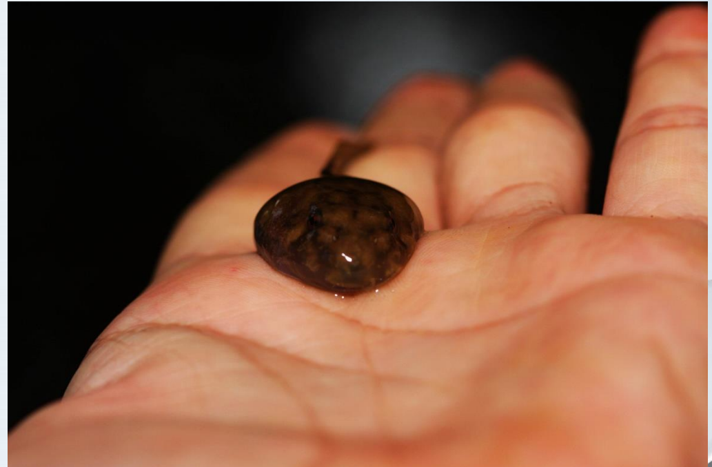
อิงกรายลายเลอะ, อึ่งผี่ ( Leptobrachium smithi )