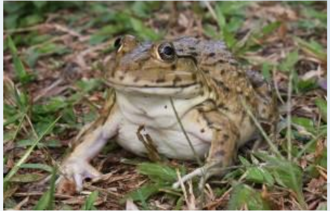
กบนา ( Hoplobatrachus rugulosus )