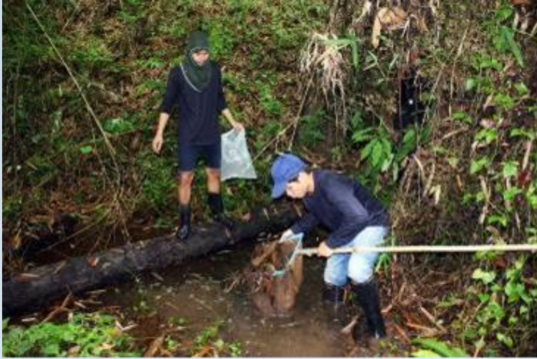
จับด้วยสวิง