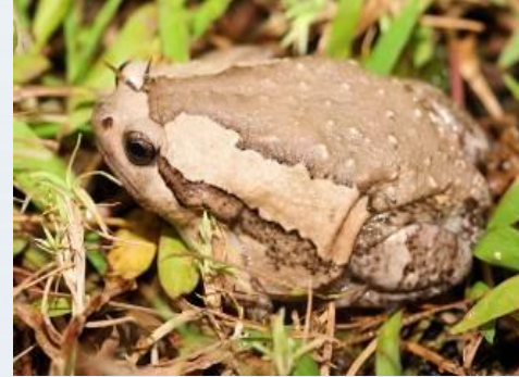
อิงอ่างบ้าน ( Kaloula pulchra )