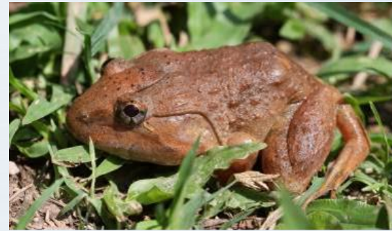
กบหนอง ( Limnonectes gyldenstolpei )