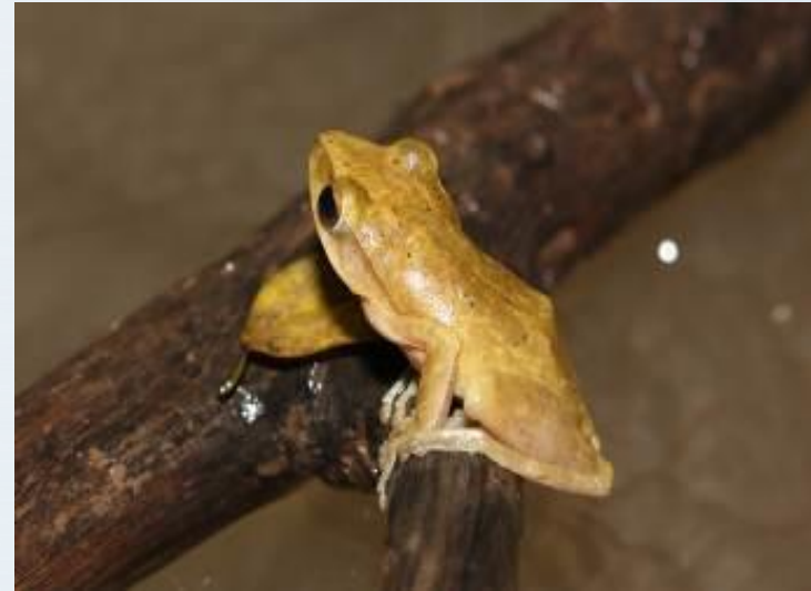
ปาดบ้าน ( Polypedates leucomystax )