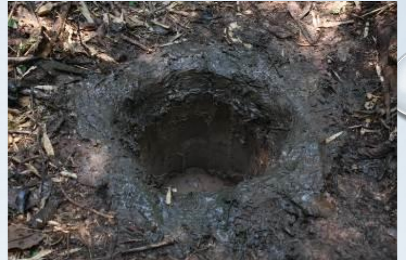
หลุมดักสัตว์สะเทินน้ำสะเทินบก