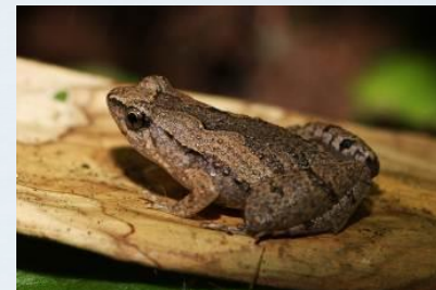
อิงน้ำเต้า ( Microhyla fissipes )