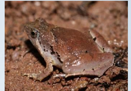
อิงแม่หนาว ( Microhyla berdmorei )