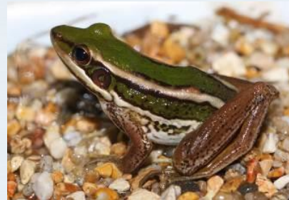
เขียดจิก ( Rana erythraea )