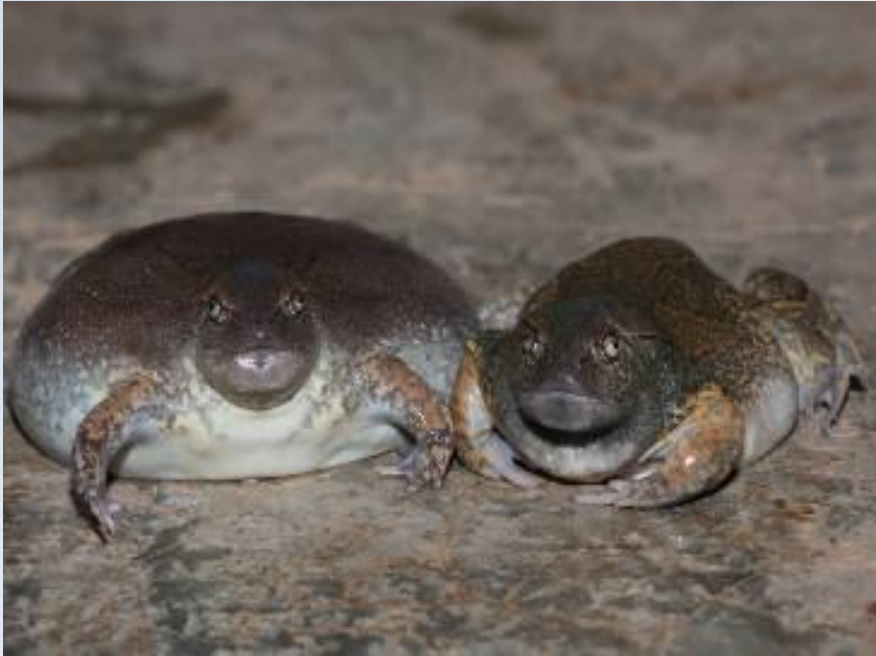
อิงเพ้า ( Glyphoglossus molossus )